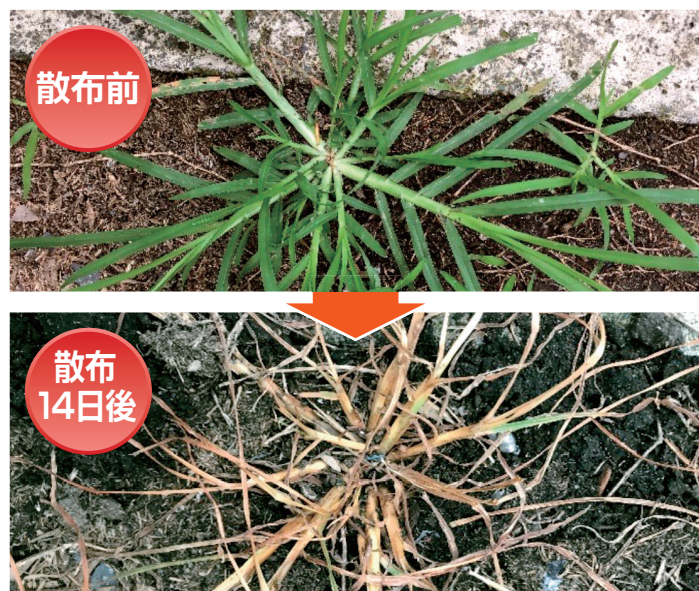
2020年 社内試験概要 場所:埼玉県児玉郡美里町 散布日:7月7日(希釈倍数:100倍) 調査日:7月21日(散布14日後)